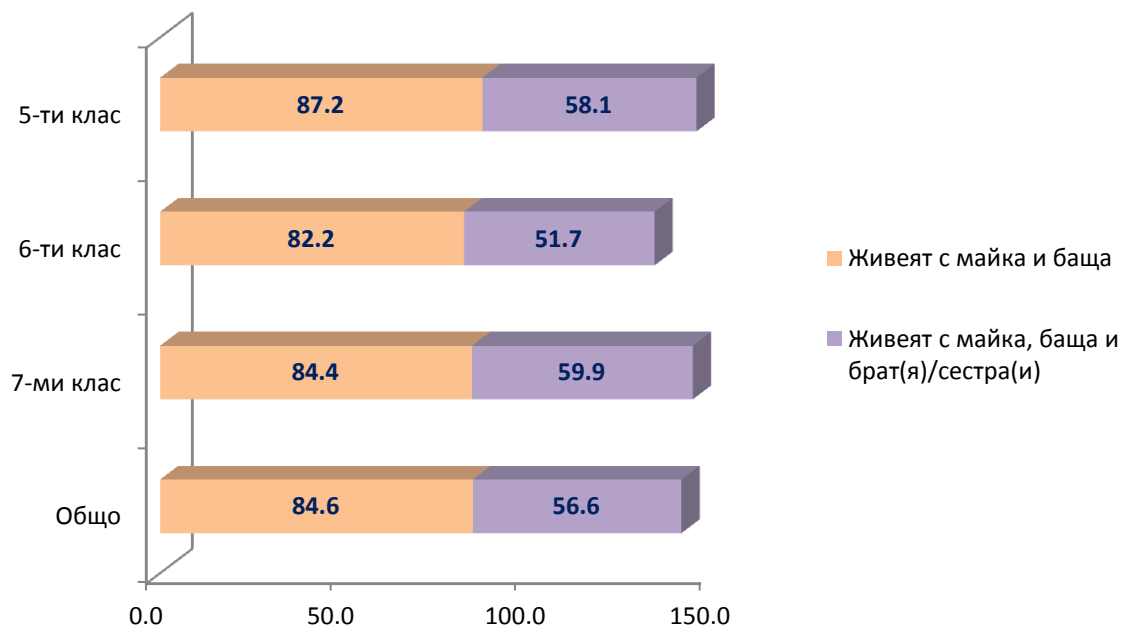
Таблица 1: Живеят ли децата в град Перник само с единия си родител, (%)